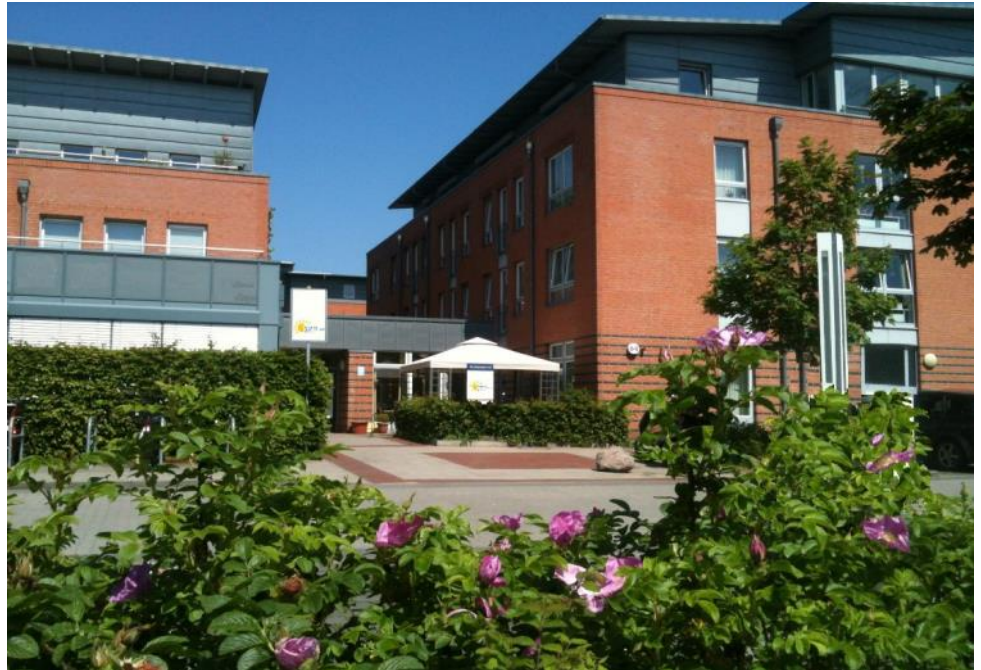
HAUS CASINOPARK Pflegeeinrichtung